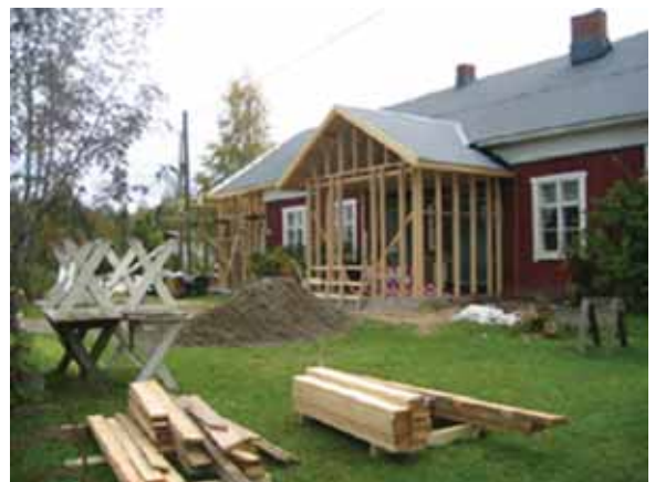
Bystugans utbyggnad och renovering 2004 - 2005

Bystuguprojektet går framåt. Festsalens väggar har fått färg. Lister och panel är på gång.