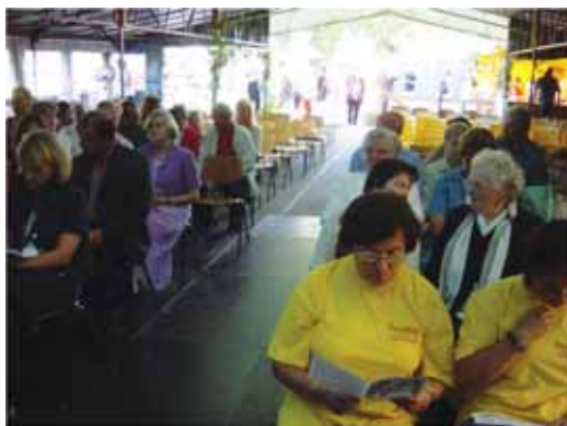
Bänkkade för Festidalsshowen.