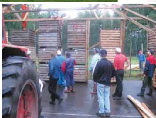
Byn förbereder festligheterna.